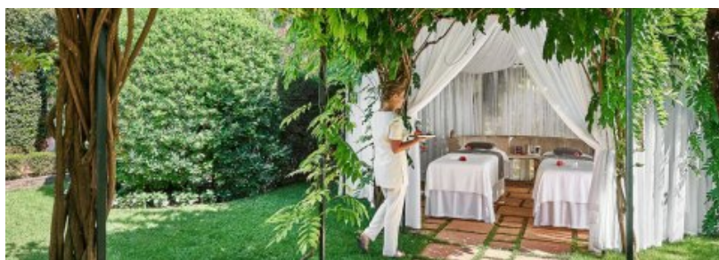
Le spa du Cap-Eden-Roc d'Antibes.

Curiosité du luxueux spa de l'Eden Roc, lové au cap d'Antibes, une cabine duo habillée d'un mur de sel pour expérimenter l'halothérapie. Cette thérapie de relaxation par le sel est bénéfique pour améliorer ses capacités respiratoires et régénérer les cellules cutanées. Au sein du havre de paix, un spa pour enfants décline différents soins pour les petits comme les ados: une séance doigts de fées (40€, env. 43 fr. 50), un massage pirates et sirènes (90€, env. 98 fr.) ou encore des nettoyages de peau pour les ados (130€, env. 142 fr.). Le plus: se faire masser dans l'une des deux cabanes spa, situées en bordure de Méditerranée. Visites en réservations.